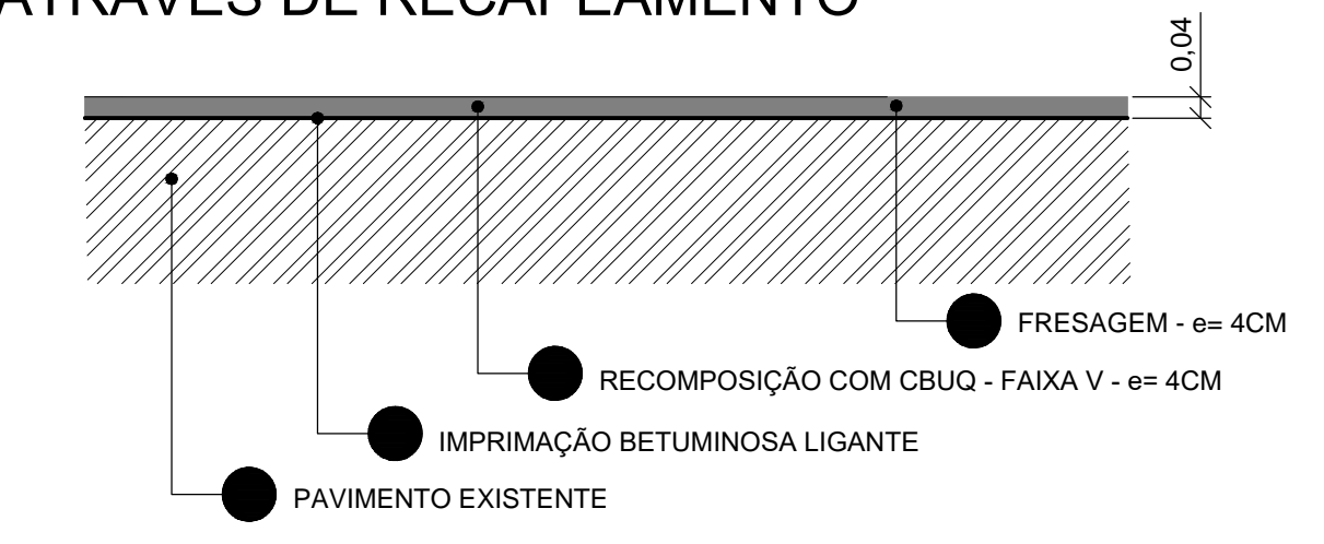
DETALHE 1 - RECUPERAÇÃO DA PAVIMENTAÇÃO ATRAVÉS DE RECAPEAMENTO

Autor do Projeto e Responsabilidade Técnica Engº Roni Leite do Nascimento CREA: 5063556500-SP ART: 28027230172771946